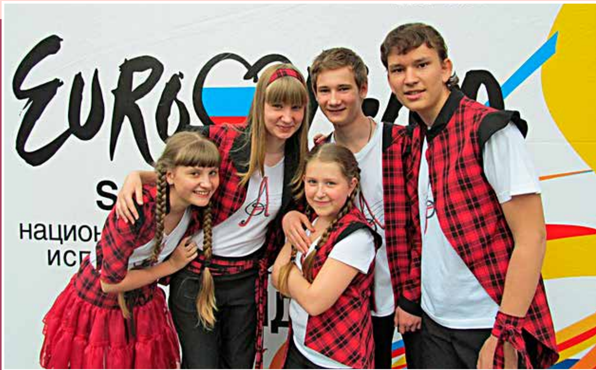
Группа «Альянс-Академия» на Детском Евровидении, г. Москва, 2012 г.

вокально-хореографического конкурса «Дети Рулят!», Гран-при международного вокального конкурса «Молодые голоса», Гран-при всероссийского открытого детского эстрадного телевизионного конкурса «Золотой петушок». Я также лауреат многочисленных всероссийских и международных конкурсов. Сказка в моей жизни случилась,